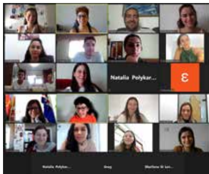
Διαδικτυακά εργαστήρια νέων στις 3 Οκτ. 2020 και στις 21 Δεκ. 2021