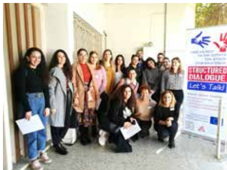
Νέες και νέοι στο εργαστήριο που πραγματοποιήθηκε στις 7 Μαρτίου 2020