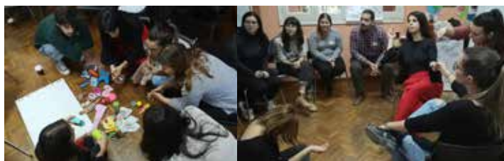
Εργαστήριο νέων που πραγματοποιήθηκε στις 30 Νοεμβρίου 2019

Σημαντικό για το χαρακτήρα του προγράμματος ήταν το γεγονός ότι η σειρά συναντήσεων των νέων είχε τη μορφή βιωματικών εργαστηρίων με ευρηματικές και διαδραστικές δραστηριότητες. Αρχικά, τα πρώτα εργαστήρια εστίασαν από τη μια στην εισαγωγή και εμβάθυνση της ομάδας νέων στις βασικές έννοιες γύρω από τα θέματα ισότητας των φύλων στην οικογένεια και από την άλλη στην κατανόηση των πραγματικοτήτων στην κυπριακή κοινωνία. Διερευνήθηκαν στο πλαίσιο αυτό ζητήματα όπως τα έμφυλα στερεότυπα και οι διάφορες μορφές οικογένειας, ενώ παρουσιάστηκαν στοιχεία για τις έμφυλες ανισότητες που εξακολουθούν να υπάρχουν στην ευρωπαϊκή και κυπριακή κοινωνία. Συζητήθηκαν επίσης ειδικά θέματα όπως το ζήτημα της βίας κατά των γυναικών, τα προβλήματα που απασχολούν τις μονογονεϊκές οικογένειες και τις διπλές δυσκολίες που αντιμετωπίζουν οι γυναίκες με αναπηρίες. Τα τελευταία δύο εργαστήρια επικεντρώθηκαν στη διαμόρφωση συγκεκριμένων εισηγήσεων πολιτικής μέσα από ομαδικές εργασίες και συλλογική μελέτη.